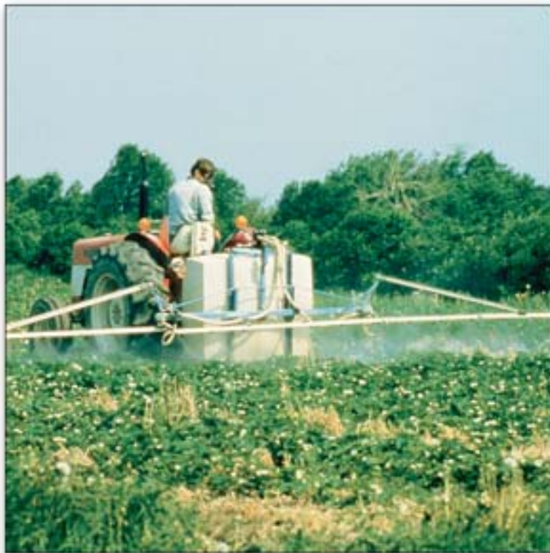
Pulvérisation de pesticides dans la culture de la pomme de terre

La culture de la pomme de terre est à l'origine d'une altération de la qualité de l'eau souterraine dans la plupart des régions du Québec où elle est pratiquée de manière intensive. Les régions les plus touchées sont celles de Portneuf (Sainte-Catherine, Pont-Rouge, Saint-Ubalde, Saint-Basile) et de Lanaudière (Saint-Thomas, Lavaltrie, Crabtree).