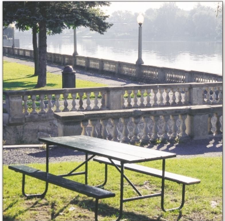
Saint-Hyacinthe et plusieurs autres municipalités tirent leur eau de cours d'eau exposés aux pesticides.

«...à l'échelle nationale et internationale, les instances gouvernementales qui s'intéressent à la qualité de l'eau potable tendent vers une approche qui vise le contrôle à la source...»