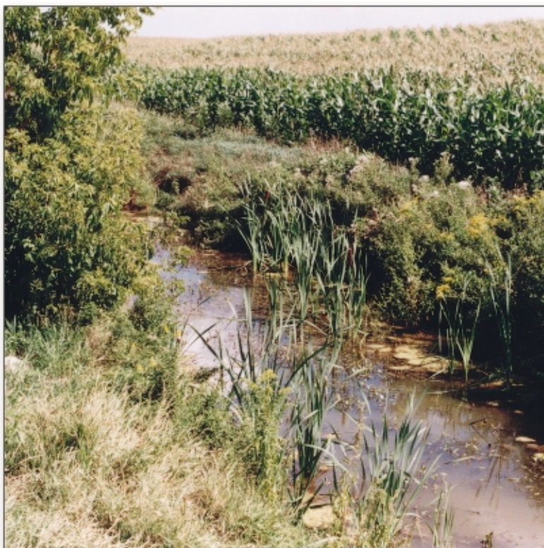
Les effets des pesticides peuvent se répercuter sur l'ensemble de la chaîne alimentaire.

Les effets des autres herbicides sont moins bien documentés. Cependant, de plus en plus de données scientifiques révèlent l'influence de faibles doses de pesticides sur les espèces aquatiques ou encore des effets additifs ou amplificateurs (synergiques) de la présence simultanée de nombreux pesticides dans l'eau des rivières.