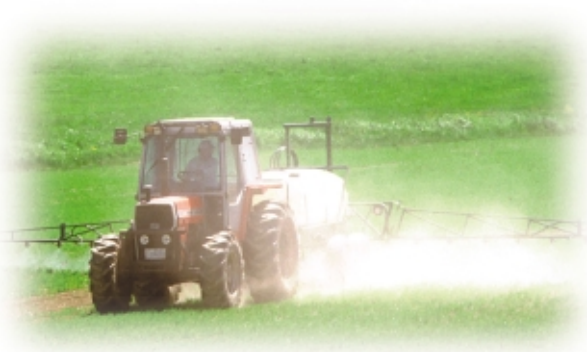
Épandage d'herbicides au printemps.