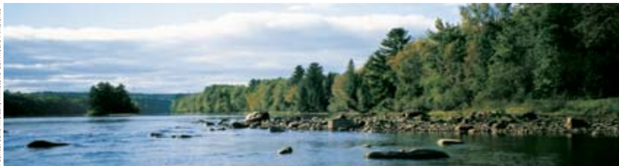
Río Saint-Maurice - Desde 1992, la Corporación de Gestión del Desarrollo de la Cuenca del río Saint-Maurice orienta sus esfuerzos más particularmente hacia el desarrollo recreativo y turístico del río, tras haber suspendido el transporte de madera en 1993.